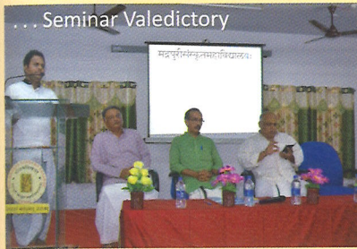
Co-ordinator welcomes the Chief Guest