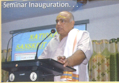
Principal addressing the seminar