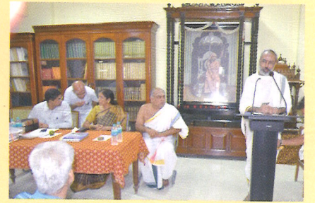
Smt. Nirmala Sitaraman, Hon'ble Minister of Commerce & Industry, Govt. of India, presided over and honoured the recipients of "Certificate of Honour" for the year 2015