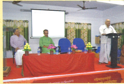
Principal addresses the function