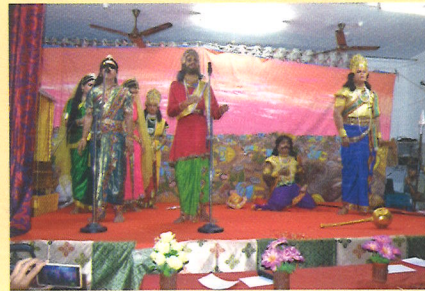
Sanskrit Drama enactment by the College students