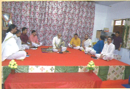
Ashtavadhanam performed by Brahmasri Chiravvuri Srirama Sarma