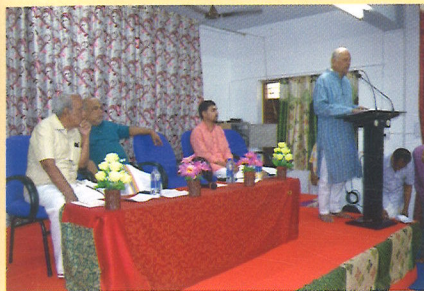
.... delivers his presidential address