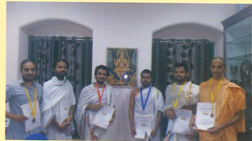
Students of our College bag Gold, Silver & Bronze Medals in various contests of the All India Sanskrit Elocution Contest, 2016