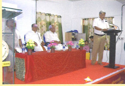
Secretary addressing the seminar